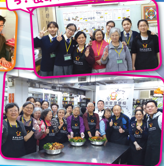
3: 長幼共融活動-盆菜製作