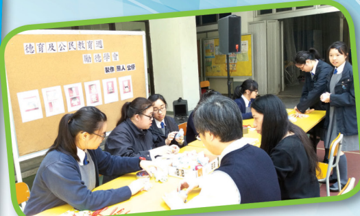
5: 德育及公民教育周-關愛